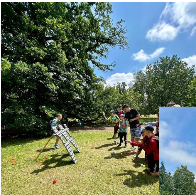
Škola v přírodě Malá skála