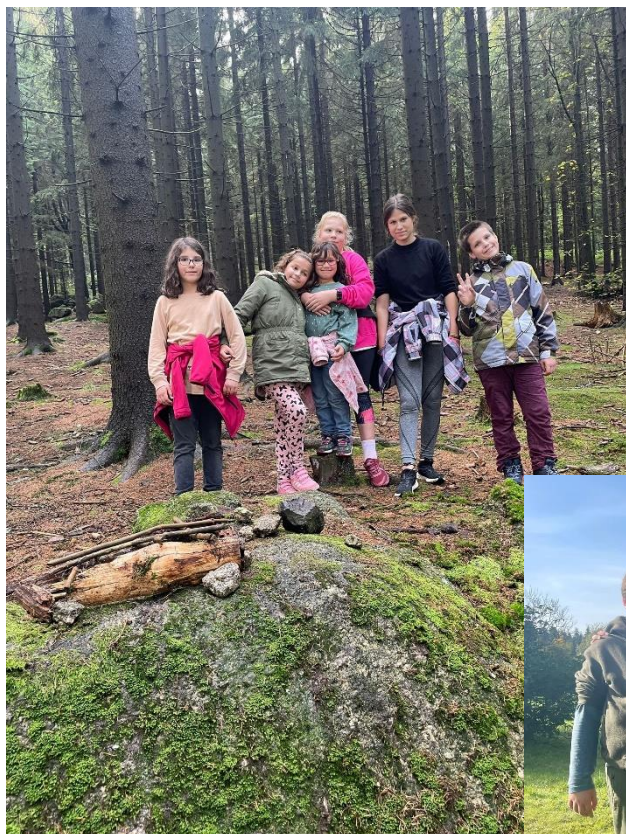
Školní rok začal taneční kroužek a pěvecký sbor soustředěním v Jizerských Horách.