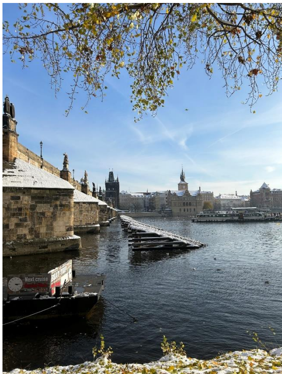
exkurze centrem Prahy s průvodcem