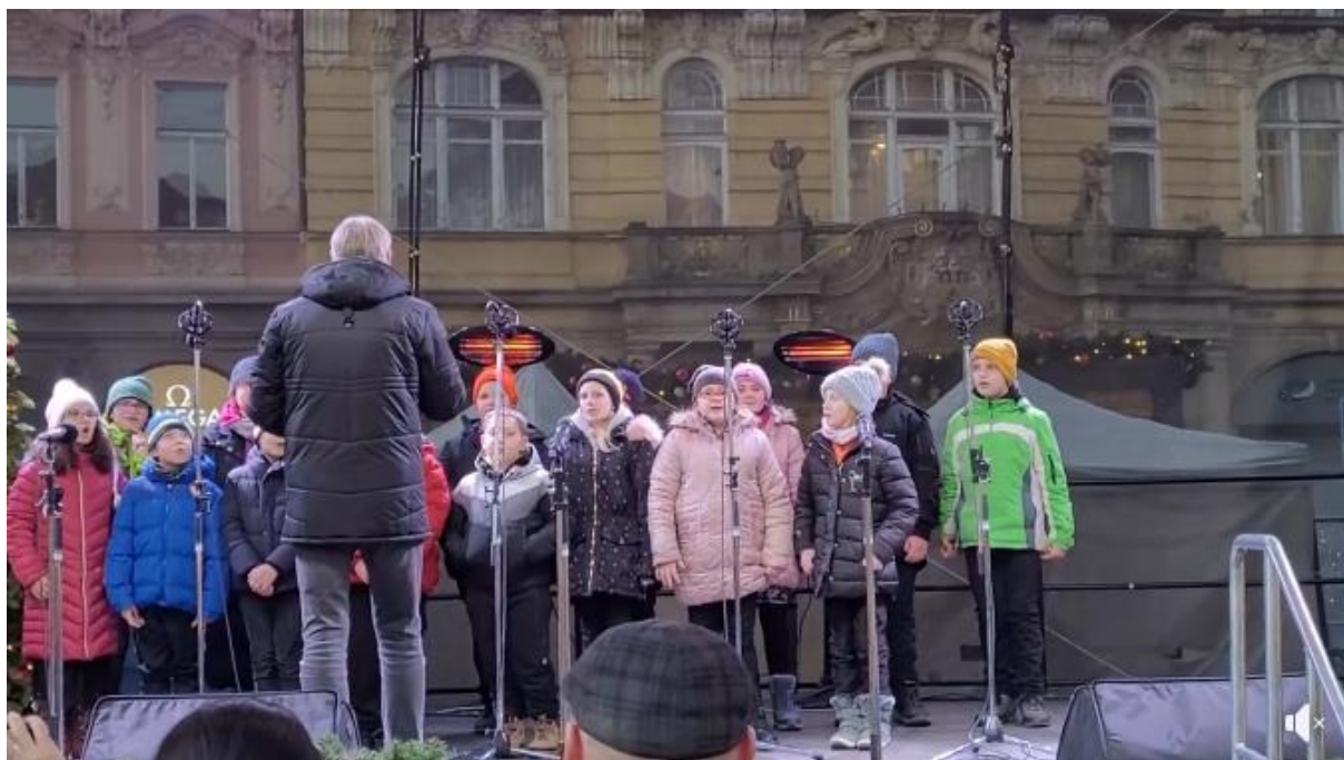
Vánoční vystoupení pěveckých sborů na Staroměstském náměstí.